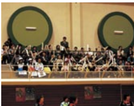
馬小のおともだちも、応援サポーターとして活躍してくれました