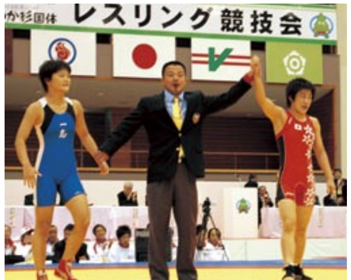
□□選手(右)と対決した□□□□さん(左:潟上市出身)