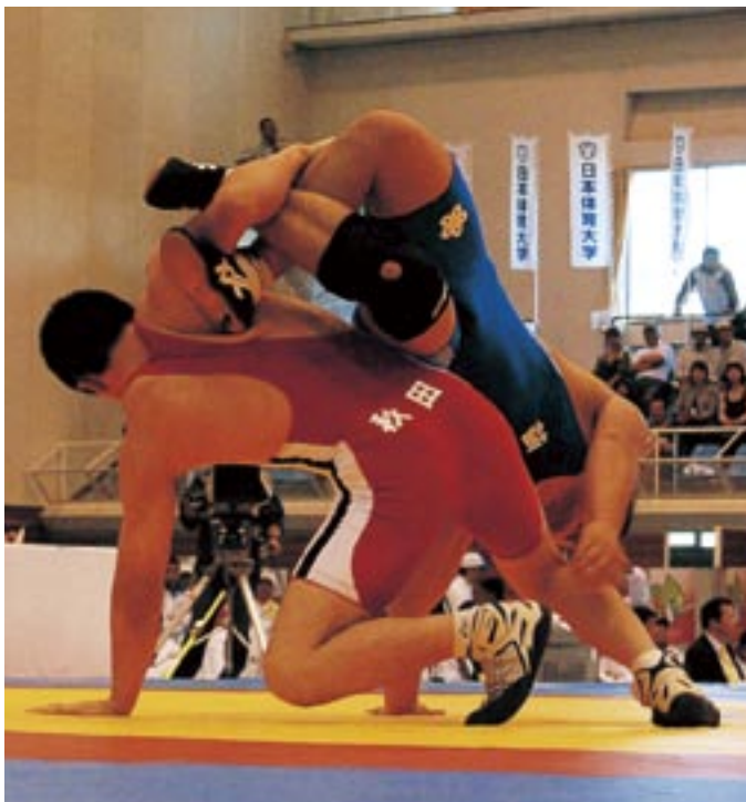
□□選手の得意技、アングルホールド