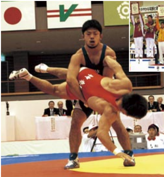
相手選手を持ち上げる□□選手(グレコローマン66kg級)

10月5日から8日までの4日間の日程で行われたレスリング競技会(成年男子)では、7人の県代表選手が出場。優勝した2人を含め、全員が3位以内に入賞する活躍を見せ、見事総合優勝を果たしました。