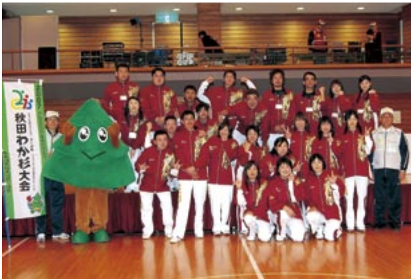
県代表チームの皆さん、お疲れ様でした