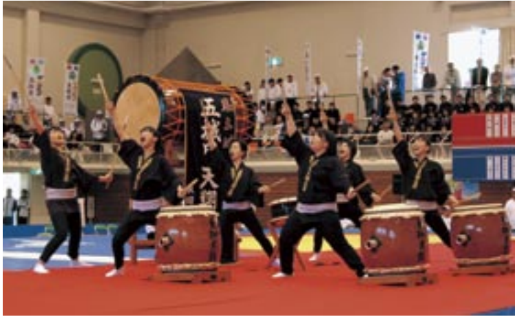
開始式で登場した五城目天翔太鼓の皆さん「天翔祝太鼓」で、開催をお祝いしてくれました

レスリング競技会の開始式と総合表彰式では、町のイベントでおなじみの2団体が登場。太鼓の音と楽しいダンスでお客さんを歓迎しました。