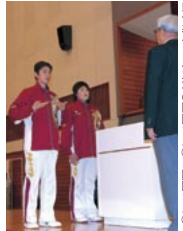
選手宣誓を行う 県代表チーム主将の□□さんと□□さん

県代表チームは、男女とも残念ながら勝利を挙げることはできませんでしたが、最後まで必死にボールを追いかける姿に、観客の皆さんから終始たくさんの声援が送られていました。