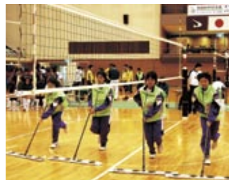
式典や競技の運営では、五一中女子バレーボール部の皆さんが大活躍