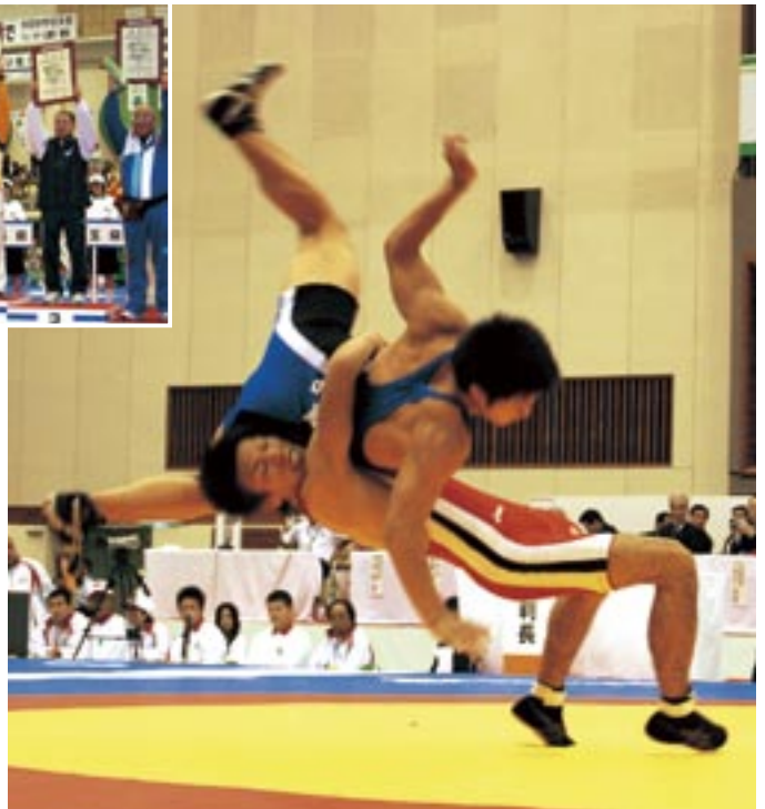
豪快な投げ技を放つ□□選手(グレコローマン60kg級)